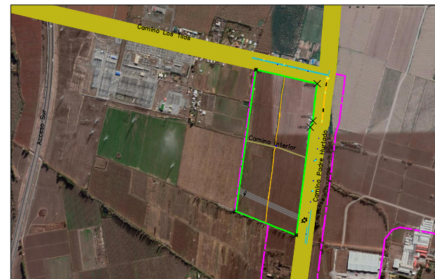
PLANTA EMPLAZAMIENTO ESCALA 1 : 5000